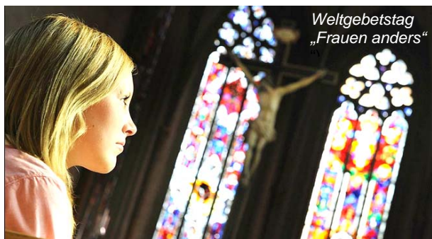
Weltgebetstag „Frauen anders“

Grenzen überwinden, weil Gottes Heil allen Menschen ohne Unterschiede gilt. Niemand ist davon ausgeschlossen. Uns Christen sollte es selbstverständlich sein, dass jeder Mensch ein von Gott geliebtes Geschöpf ist und damit „gleich-wertig“. Da haben wir in der Kirche noch manches aufzuarbeiten. Ein Beispiel wäre das Thema „Frau in der Kirche“. Es gibt so viele mutige, kompetente, tiefgläubige Frauen, die etwas bewegen und bewirken können und möchten....Wann werden da die Grenzen überwunden? A.Ferbach