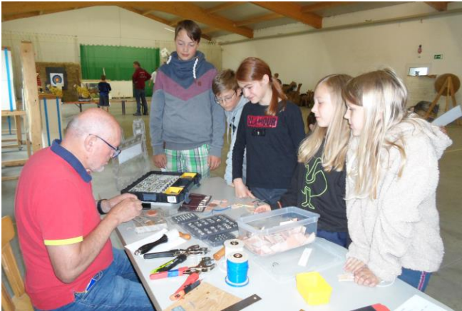
Foto: Peter Schölderle hat für jede Teilnehmerin und jeden Teilnehmer am Holliday Cup einen individuellen Lederanhänger hergestellt.

In der Klasse 8 bis 10 Jahre: 1. Platz Valentin Münch Eberhardzell, 2. Platz Lukas Glantschnig Eberhardzell und Niklas Branz aus Hummertsried.