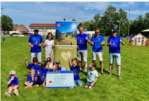
Große Freude bei der Scheckübergabe an „Zusammen Berge Versetzen e.V.“