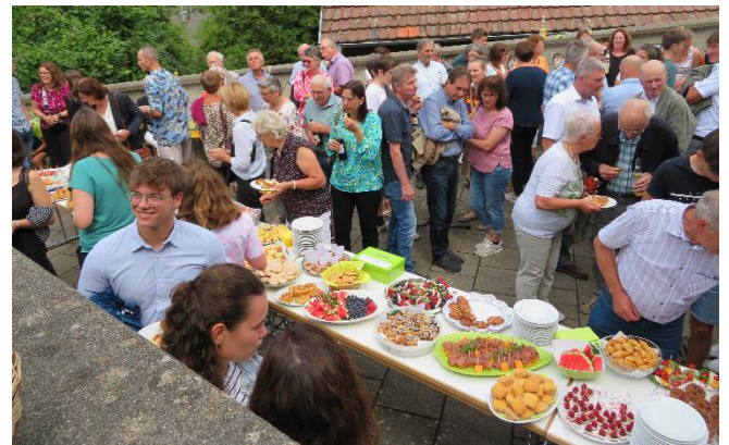
Gemütlicher Abschluss beim Stehempfang hinter der Kirche