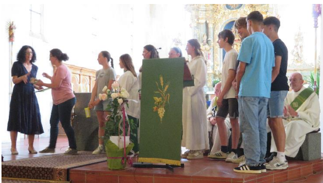
Die Minis aus den vier Gemeinden überraschten mit einem Quiz