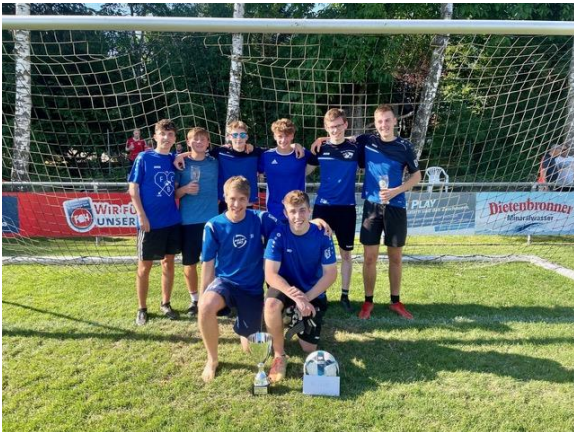
Die SGM Edeltechniker/Holzfüße erreichte beim Elfmeterturnier den ersten Platz.