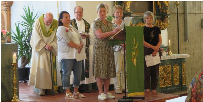
Das „Team Trauerbegleitung“ der Seelsorgeeinheit