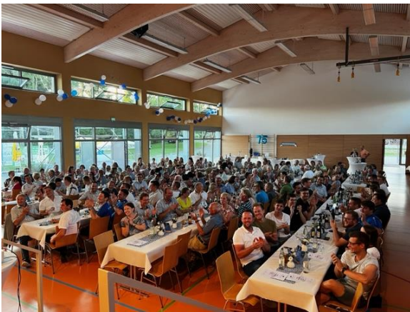
Rund 170 Gäste erlebten in der Halle Bellamont einen kurzweiligen Ehrungsabend.

Trotz der heißen Temperaturen haben die 5- bis 12-jährigen Läuferinnen und Läufer am Nachmittag beim Kinderspendenlauf einen beachtlichen Betrag in Höhe von 2.100,10 Euro erlaufen. Der gesamte erlaufene Betrag wurde an „Zusammen Berge Versetzen e.V.“ gespendet. Den Startschuss machte das Maskottchen des 1. FC Heidenheim, Paule. Im Anschluss erkundete Paule gemeinsam mit den Kindern die aufgebauten Spiel- und Spaßstationen auf dem Sportplatz. Damit ging ein buntes Jubiläumswochenende zu Ende. Ein herzliches Dankeschön allen Helfern, die zum Jubiläumswochenende beigetragen haben. Eine Bildergalerie mit Bildern vom Jubiläumswochenende ist unter www.fcbellamont.de zu finden.