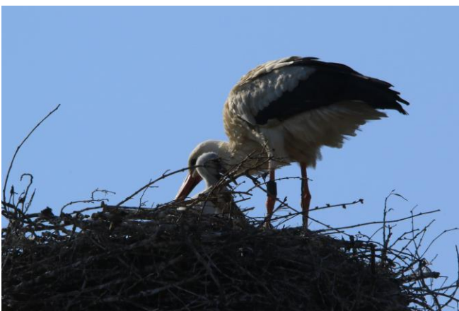
Winterstettendorf: Störchin A8W53 kümmert sich um ihren Nachwuchs