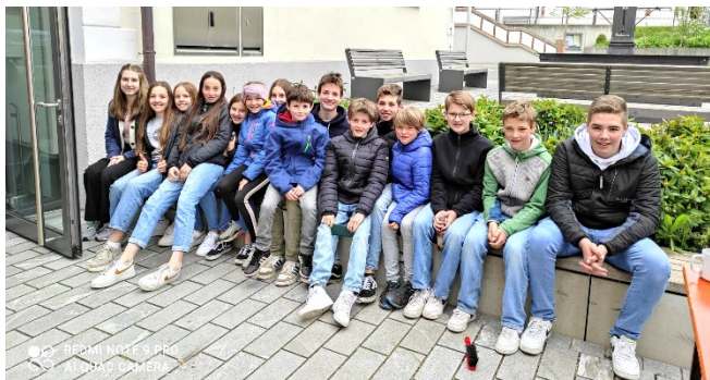
Das Mini-Team mit der ganzen Mini-Schar.

Danke allen, die am Muttertag dazu beigetragen haben, dass unser Stehcafe gelungen ist: der Dorfgemeinschaft für die Kaffeespense, den Eltern für das Kaffee kochen und das Gebäck und allen Kirchenbesuchern und Spendern. Das Geld verwenden wir für das Mini-Wochenende im September.