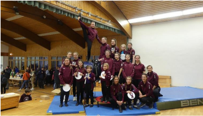
Das gesamte Eberhardzeller Team