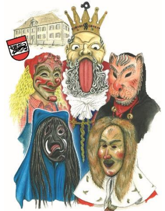
Narrenzunft „Zeller Schwarze Katz“ Eberhardzell e.V. gegründet 1958