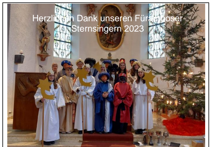
Herzlichen Dank unseren Füramöser Sternsängern 2023