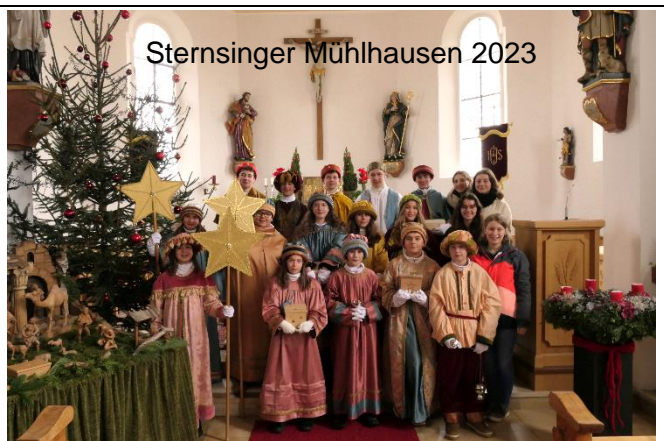
Stersinger Mühlhausen 2023

18:30 Uhr Rosenkranz 19:00 Uhr Eucharistiefeier