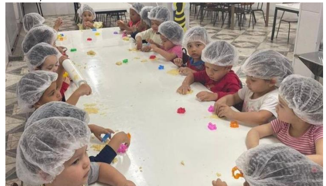
Kurze Präsentation der Aktivitäten von Cei Cata- rina Kentenich

Durch die gesammelten Spenden kann das Projekt des verstorbenen Schönstattpaters Franz Hörnle, das „Kinderzentrum ‚Catarina Kentenich‘ in Jaragua, Sao Paulo, weiterhin unterstützt werden.