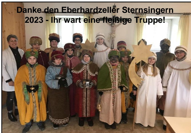
Danke den Eberhardzeller Sternsängern 2023 - Ihr wart eine fleißige Truppe!

18:30 Uhr Rosenkranz 19:00 Uhr Eucharistiefeier