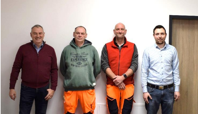
(v. l. Herr Bürgermeister Grabherr, Herr Weller, Herr Nitsch und Herr Frick)

Herr Weller übernimmt die Leitung von Herrn Nitsch, der weiterhin als Mitarbeiter im Grünbereich und im Bauhof der Gemeinde tätig ist.